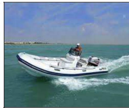
Ein- und Ausschiffung